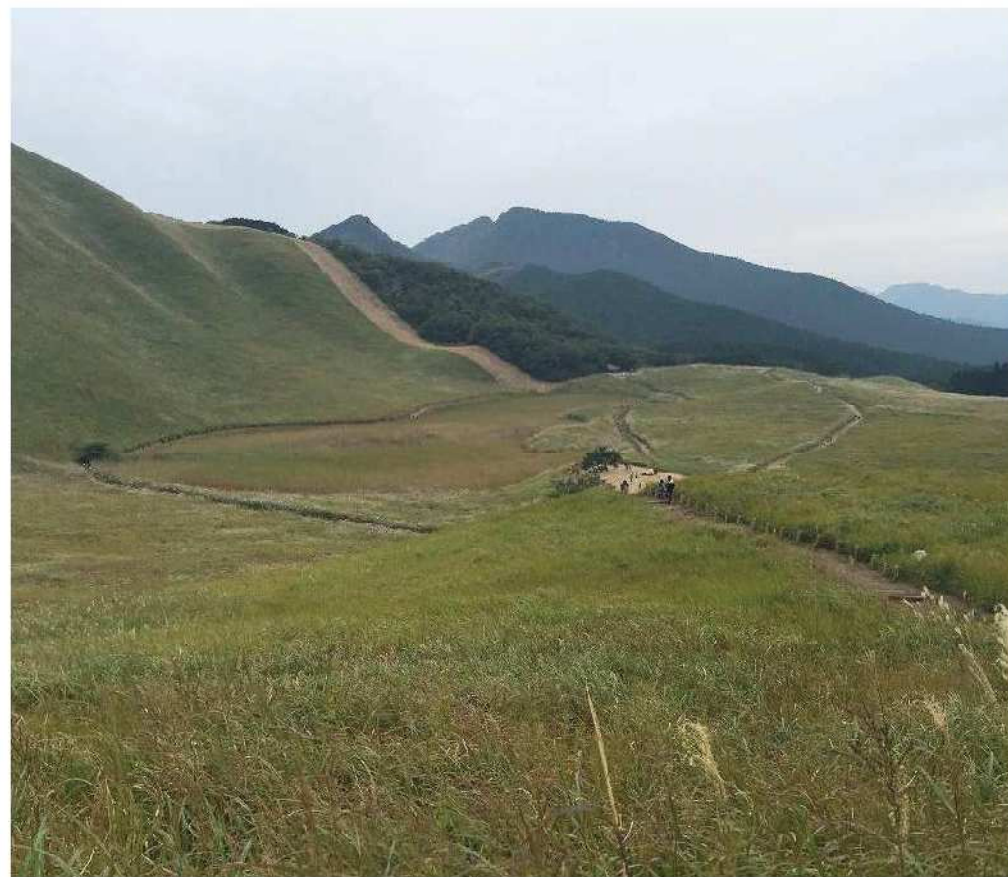
曾爾高原(そにこうげん)

奈良県と三重県の県境に位置した国立公園。俱留尊山(標高1038m)と亀山(標高849m)の西斜面から麓に広がる高原で、平坦地の標高は約700m、面積は約38ha。秋には「お亀池」という湿地帯を除いて一面がすすきに覆われる。