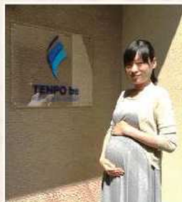
お腹、大きくなりました

出産も子育ても初めてのことなので、想像がつかないのが正直なところですが、早ければ産後半年くらいで仕事復帰できるのかなあと考えています。その際は、また宜しくお願いします。