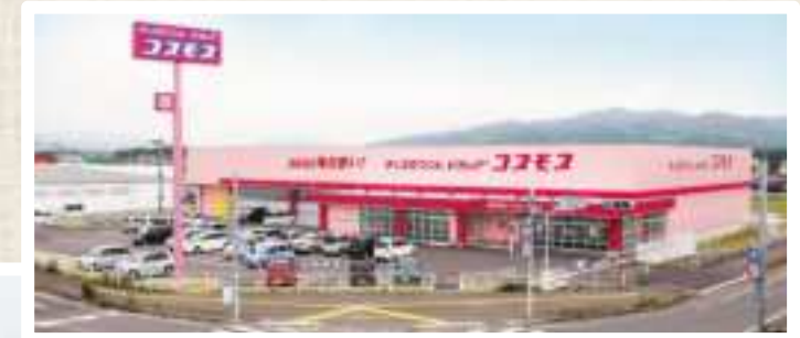
ドラッグコスモス

最近、「ドラッグコスモス」や「クスリのアオキ」のような、今までにないような超大型のドラッグストアが、関西に出店数を増やしています。