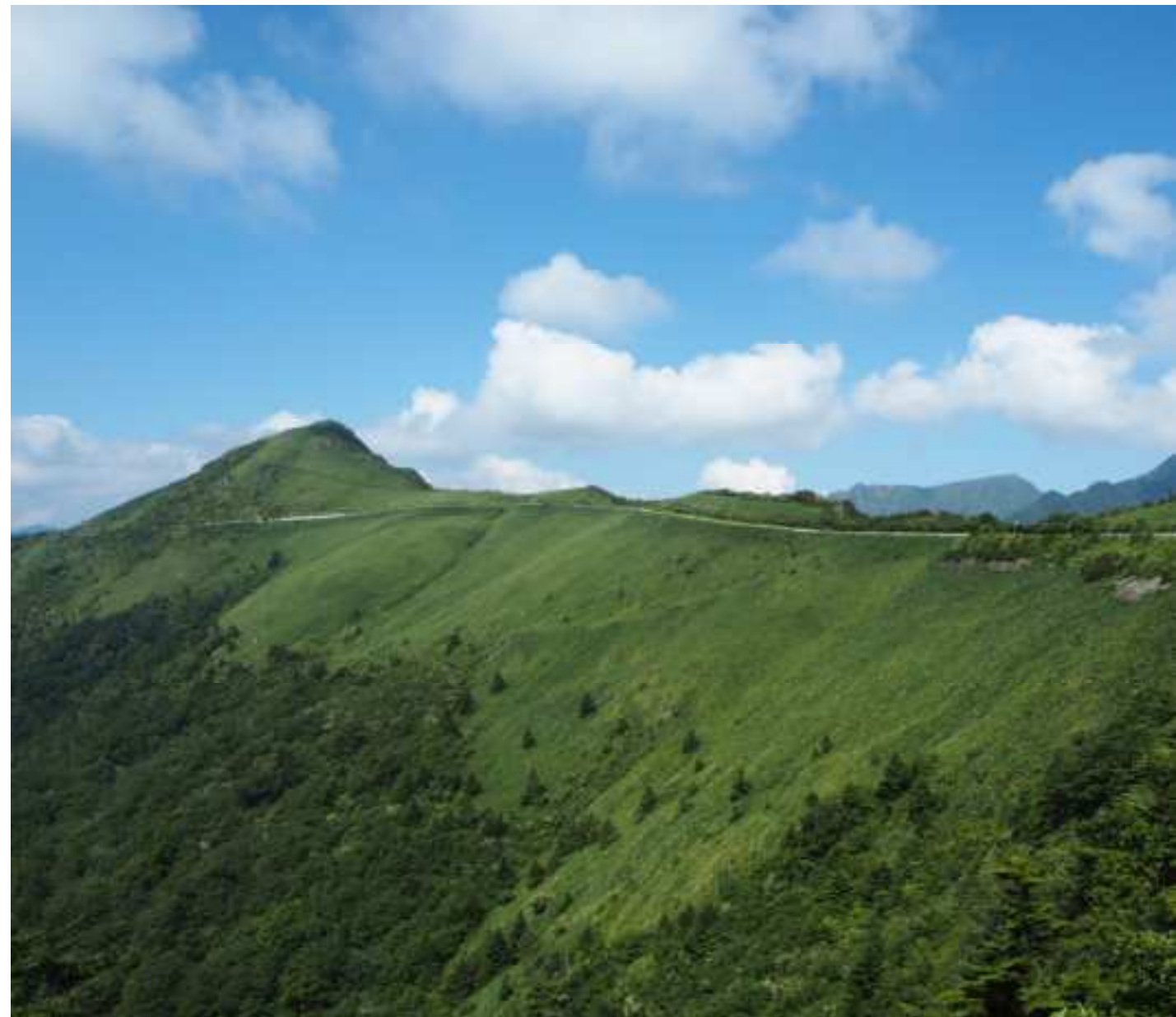
「瓶ヶ森林道(かめがもりりんどウ)」

内容や読み方は、一通りではなかったり、多少地域差もあるようです。また、建築予定地で地鎮祭をするのが本来ですが、最近では、鎮め物だけしたり、地鎮祭をしないケースも増えているようです。 (文責：辻川)